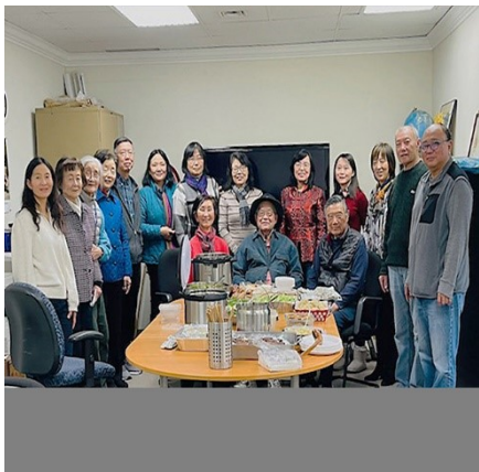
参加树华工作会的义工