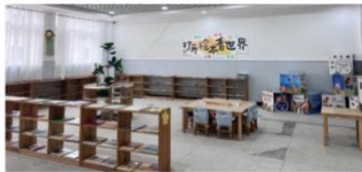
正安第八幼儿园新布置的图书室，深受老师和孩子们的喜爱。

树华团队 10 月看到原来空空荡荡的图书角，现在摆上了孩子们喜爱的各种绘本，老师们开心地告诉义工，每天都会组织孩子们阅读。看着宽敞明亮的图书室，义工们感到十分欣慰。