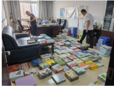
新书送到正安教体局，准备分发各幼儿园

2024 年 6 月，项目进入收尾阶段。正安教体局对 1235 本书（总价值 59322 元人民币）逐一审核，并签发了验收单。这些凝聚了无数心血的书籍，终于送到了孩子们手中。