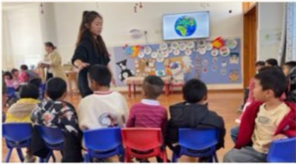
环保小课堂：“爱我们的地球”

导孩子们理解环保知识。当老师问：“孩子们，我们的家在哪里？”几十名孩子齐声回答：“中国！”稚嫩而响亮的童声感动了我们每一个人。