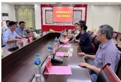
树华义工与瑞金三中老师和同学的座谈会

在接下来的几天，我们探访了瑞金二中和三中，还走访了两所学校部分受助学生的家庭。三中的校领导特地调整了时间安排，让考完试的高三学生与我们进行了短暂简单的座谈，我们了解了更多孩子的故事。每一所学校、每一名学生，都让我们感受到基层教育者的坚守和孩子们对未来的渴望。座谈结束后，有些孩子依依不舍，拉着我们的手，不断感谢，甚至主动拥抱，这些温暖的举动让我们深受感动。在拥抱和话语间，我们不断鼓励他们坚持下去，努力追逐梦想。这些简单的举动让我们觉得，所有的努力都是值得的。