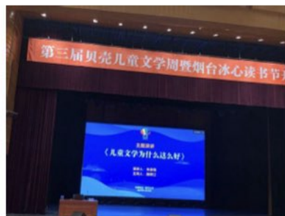
笔者参加山东烟台 第三届贝壳儿童文学周

我承认，我是真正地爱上了文学、文字及其背后所展现的人性善恶，古人的生存状态何尝不是我们现在每个人的生存状态呢？这在我21岁之前是从未思考、感悟过的，我想，这便是上大学的重要意义吧！